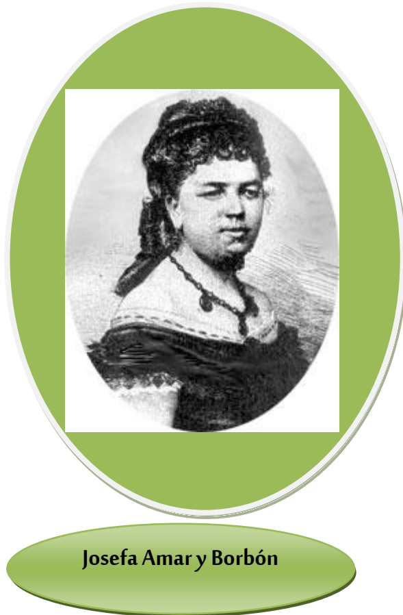
Josefa Amar y Borbón